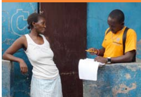
Enumération d'une femme cheffe de ménage, Carrefour-Feuilles