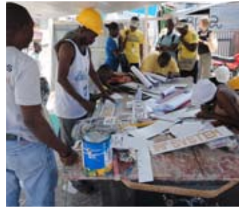
Fabrication des plaques pour l'adressage, Bristout-Bobin