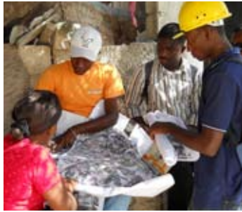
Equipe de repérage du bâti au travail, Saieh