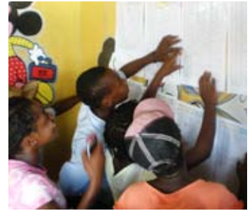
Validation communautaire des résultats de l'enquête, Carrefour-Feuilles